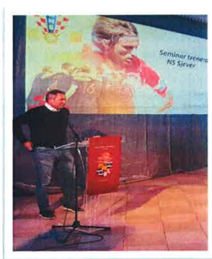
g. Matjaž Kek