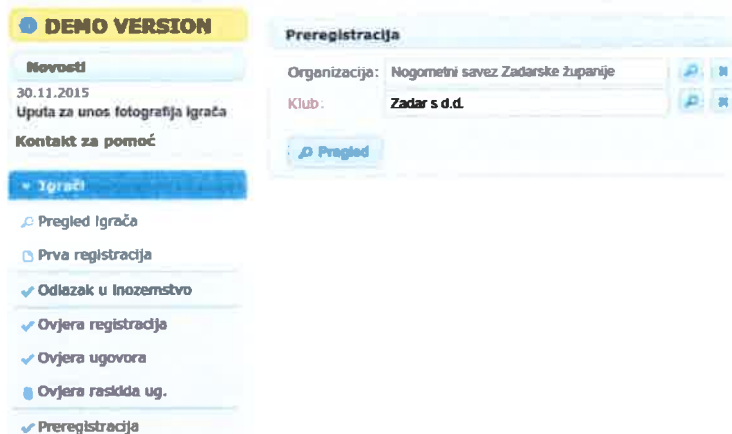
Slika 2. Pretraživanje igrača za preregistraciju

Nakon odabira opcije "Preregistracija", korisnik treba odabrati željeni klub (ukoliko je ovlaštena osoba registracijskog saveza), te odabrati opciju "Pregled". Ukoliko je korisnik ovlaštena osoba kluba, klub će biti automatski odabran.