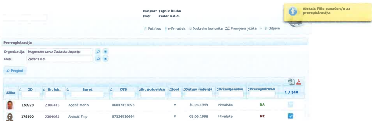
Slika 4. Oznaka igrača

Ukoliko klub ima pristup COMET sustavu, ovlaštena osoba kluba dužna je označiti one igrače koji ulaze u proces preregistracije. Na taj način savezu će biti vidljivo koje igrače treba preregistrirati te nikakva daljnja dokumentacija nije potrebna. Označavanje igrača vrši se klikom na "kvadratić" u zadnjem stupcu tablice koja prikazuje listu igrača.