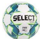
SLUŽBENA LOPTA SUPERSPORT PRVA HMNL