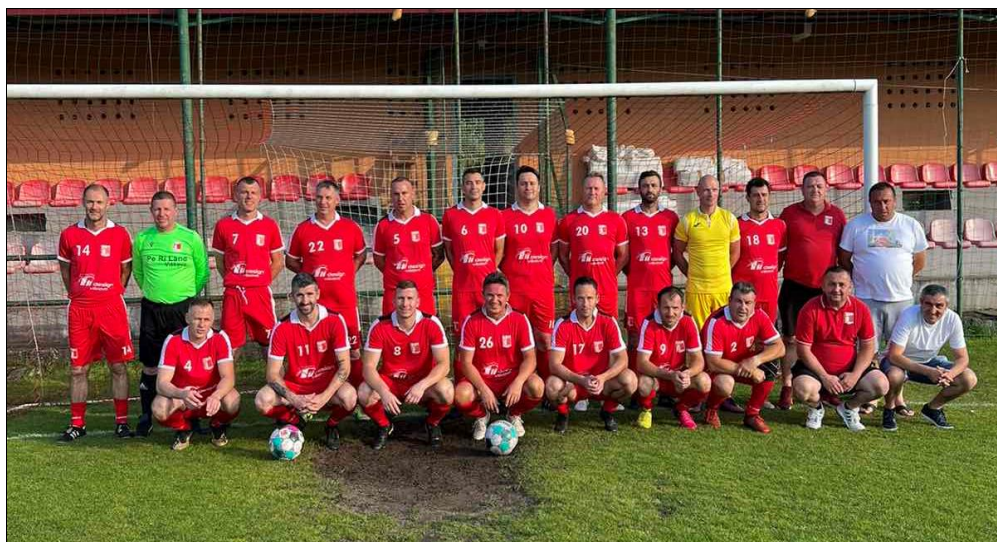
Prvaci Skupine „A“, sezona 2022./2023., veterani Halubjan Viškovo