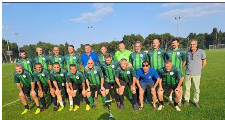
Prvaci skupine „Jug“ sezona 2022./2023., veterani NK Banjole