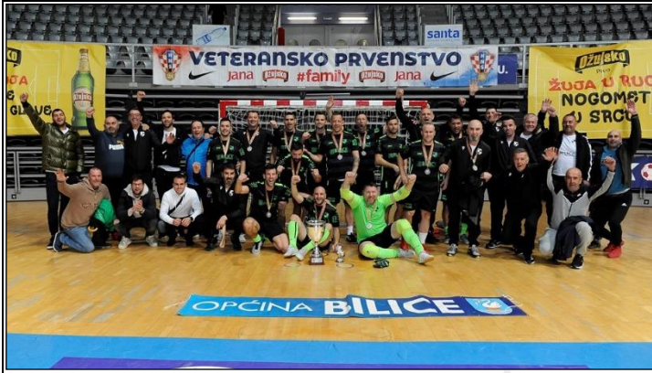
drugoplasirana momčad MNK BILICE, Bilice