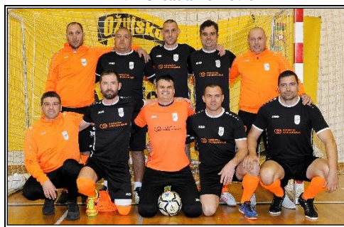
MNK Stari Grad, Šibenik