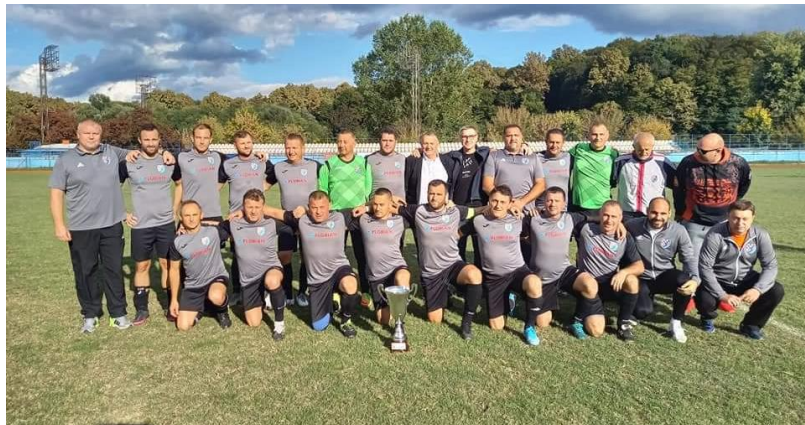
Prvaci lige veterana NS Kutina sezona 2022./2023., HNŠK Moslavina, Kutina