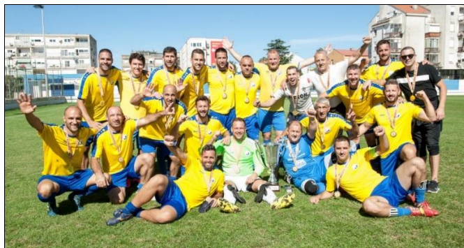
NK Sabunjar Privlaka – pobjednici 22. prvenstva veterana HNS-a