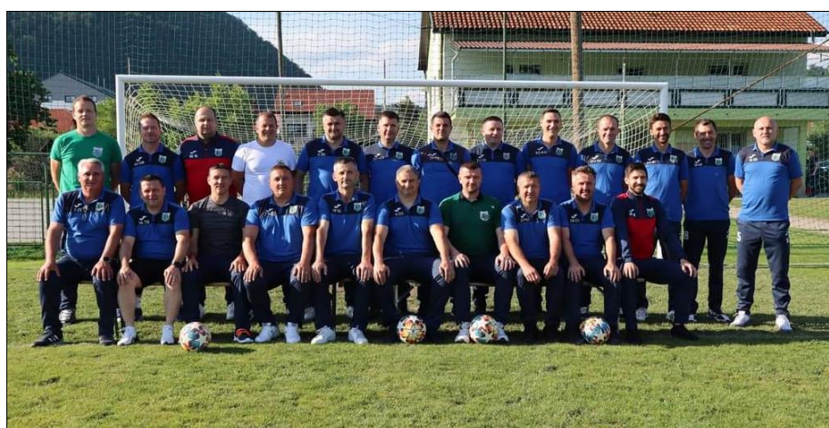
Prvaci II ŽNL veterana NS KZZ, sezona 2022./2023., Pregrada

Samo PEER (NK Straža) 26 pogodaka (3 KU)