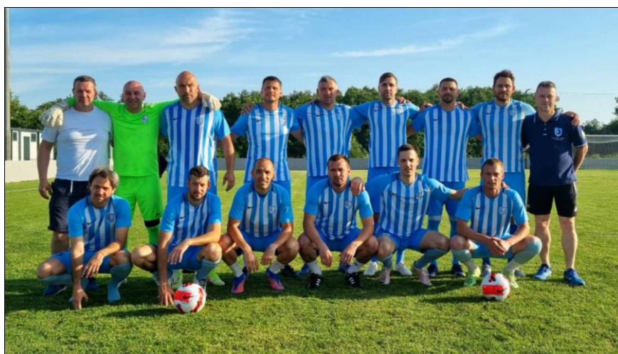
Prvaci skupine „Sjever“ sezona 2022./2023., NK Jadran-Poreč