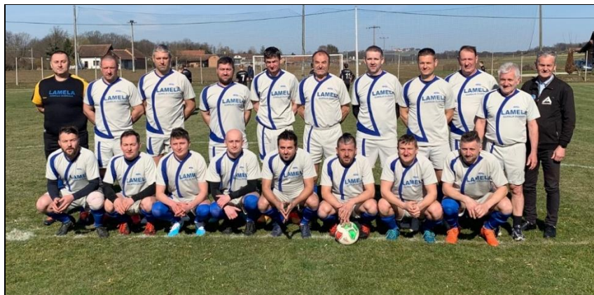
Prvaci skupine „Sjeverozapad“ LV MNS, sezona 2022./2023. NK Dubravčan, Gornja Dubrava