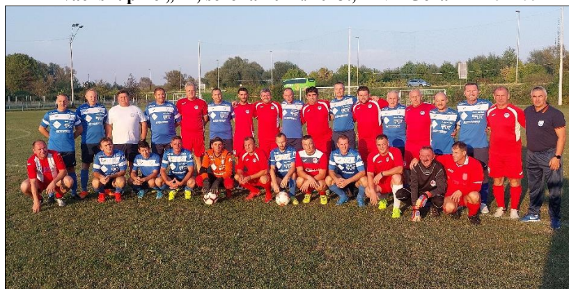
veterani Gomirja na prijateljskoj utakmici u Karlovcu s veteranima Mostanja