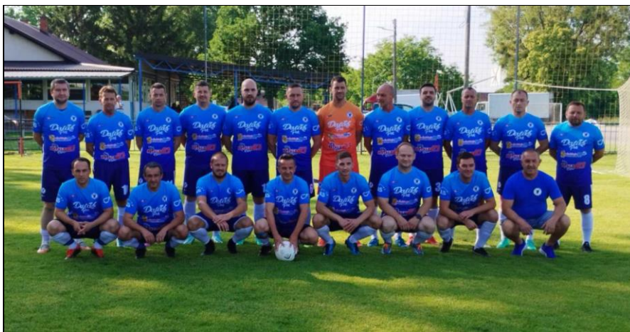
Prvaci skupine „A“ LV MNS, sezona 2022./2023., NK Vidovčan, D. Vidovec