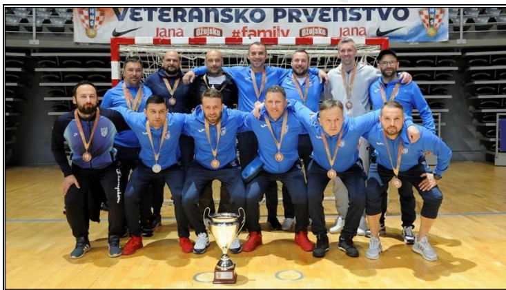
Treće mjesto; NK Jadran-LP, Luka Ploče