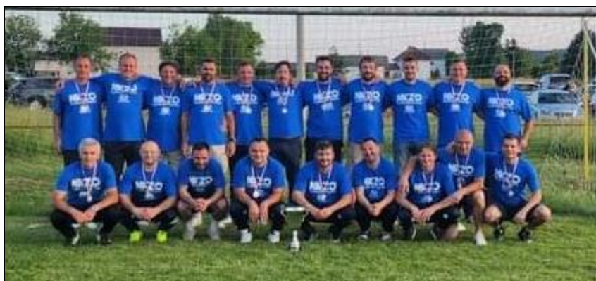
Prvaci LV NS Jastrebarsko, sezona 2022./2023., Zrinski Ozalj veterani

Drugoplasirana momčad prvenstva veterani NK Čeglji