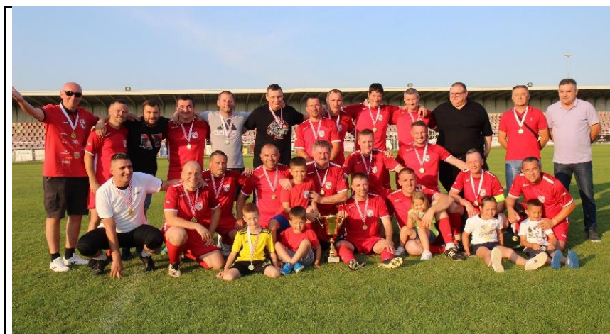
Prvaci LV NS Dugo Selo, sezona 2022./2023., Vrbovec veterani