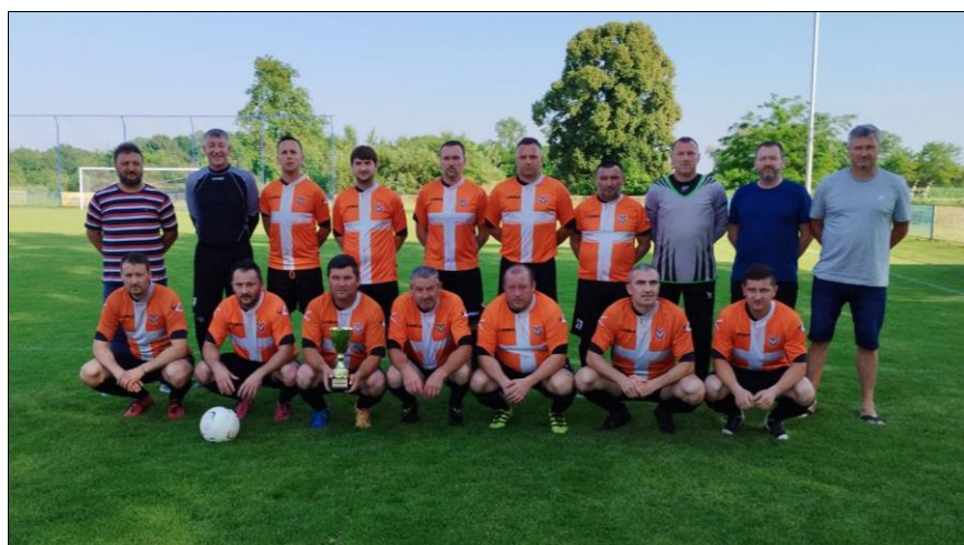
Prvaci skupine „B“ LV MNS, sezona 2022./2023. veterani NK Sokol Vratišinec