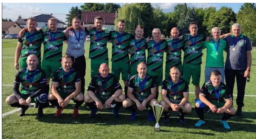
Prvaci lige veterana Skupina „Zapad“, sezona 2022./2023., Hrašćica