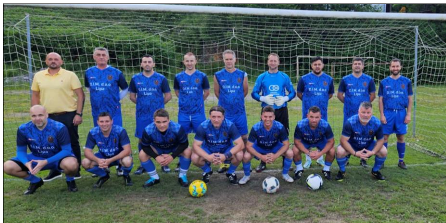
Ukupni prvaci Nogometnog saveza Primorsko-goranske županije za sezonu 2022./2023. je momčad NK 5. Zborno područje, Rijeka