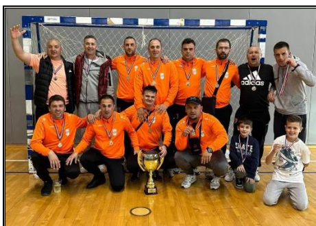
MNK Stari Grad, 2. mjesto