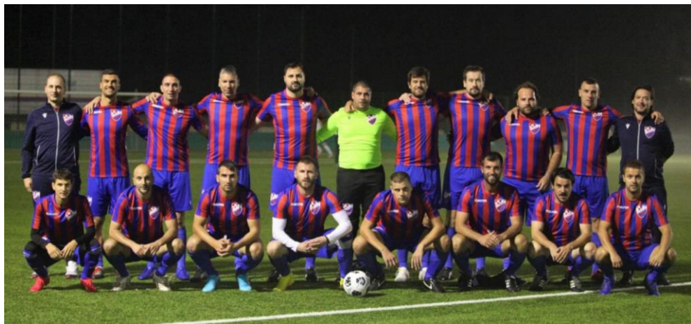
Prvaci sezone 2022./2023. VHNK Dubrovnik