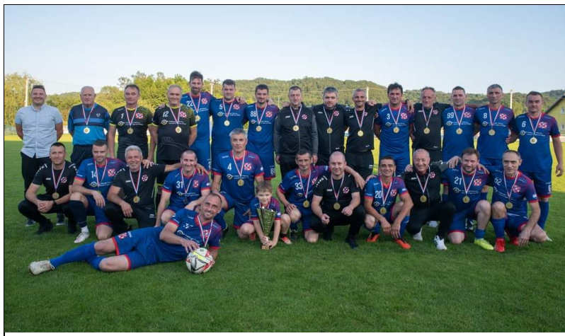
Prvaci lige veterana skupina „Istok“, sezona 2022./2023., Polet Tuhovec