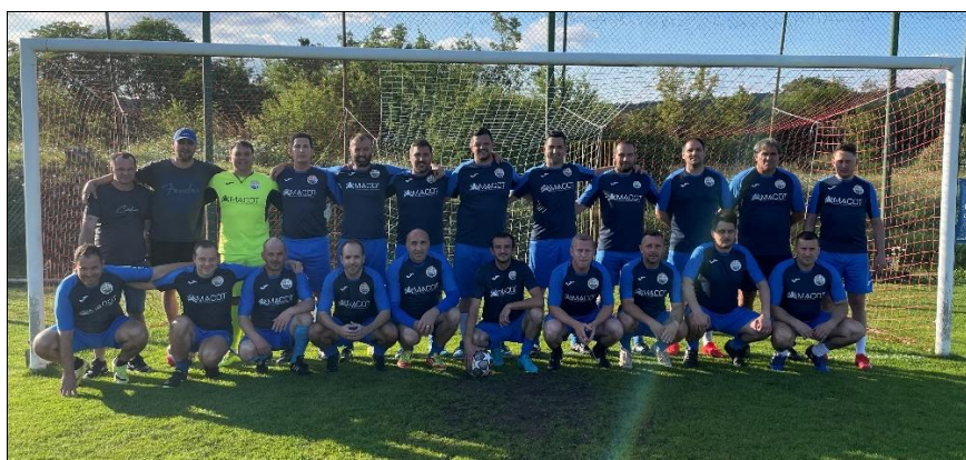
Prvaci skupine „C“, sezona 2022./2023., Gornji Zamet