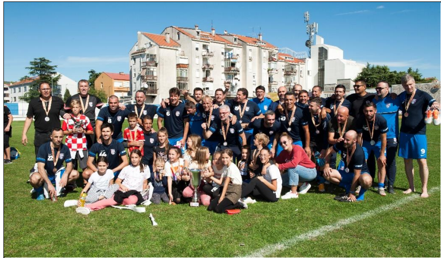
Veterani Neretva Metković , viceprvaci na velikom nogometu i četvrtfinalisti na malom nogometu, te županijski viceprvaci za sezonu 2022./2023.

Na 20. dvoranskom prvenstvu veterana HNS-a u Zadru 24.-26. veljače 2023., Nogometni savez Dubrovačko-neretvanske županije predstavljalo je 6 momčadi.