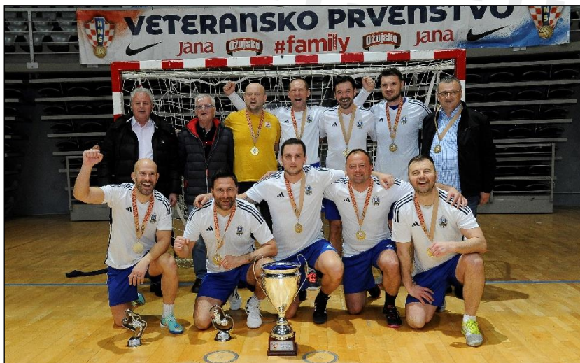
Lokomotiva Zagreb veterani – pobjednici 20. dvoranskog prvenstva HNS-a