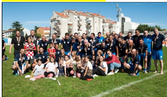
2. - mjesto: NK Neretva Metković