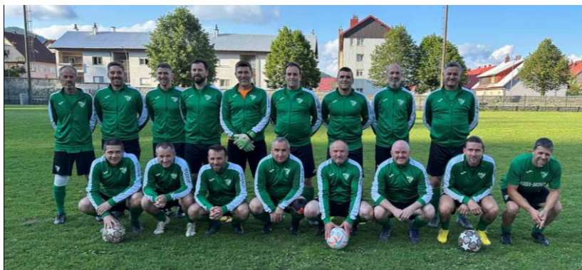
Prvaci skupine „B“, sezona 2022./2023., HNK Goranin Delnice