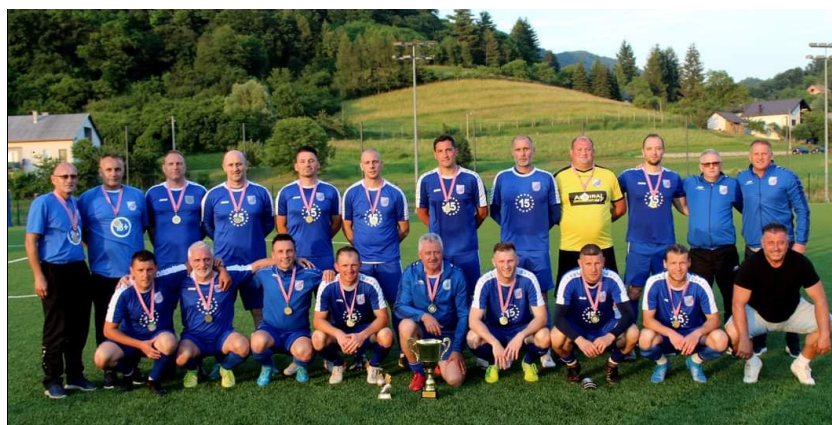
Prvaci I ŽNL veterana NS KZZ, sezona 2022./2023., Zagorec, Krapina veterani