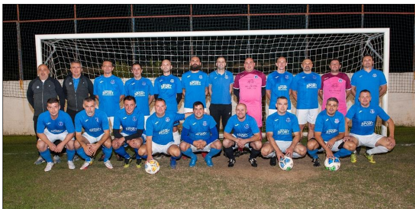
Veterani NK Jaska-Vinogradar nastup na 22. prvenstvu veterana HNS-a u Metkoviću

NK Veterani Zaprešić , Zaprešić su u skupini „E“ u obje utakmice u skupini ostvarili pobjede, najprije protiv veterana Zagorec Krapina 1:0, a u drugoj 3:1 protiv veterana Halubjan Viškovo i tako kao prvoplasirani osigurali nastup u osmini finala. U osmini finala su poraženi od veterana NK Jadran LP, Luka Ploče 2:1 i tako završili svoj nastup na prvenstvu.