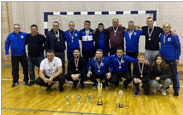
Prvo mjesto veterani NK Zagorec Krapina I