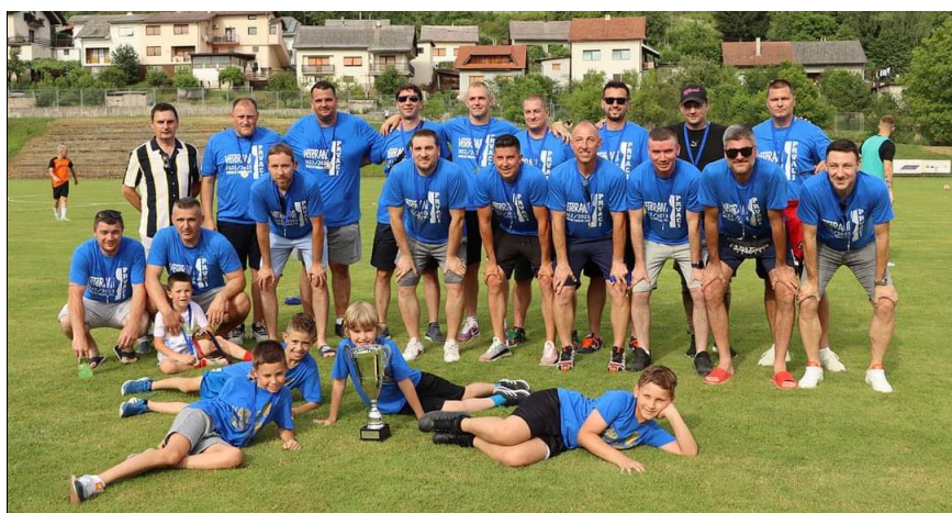
Prvaci LV NSKŽ, sezona 2022./2023., Karlovac 1919 veterani