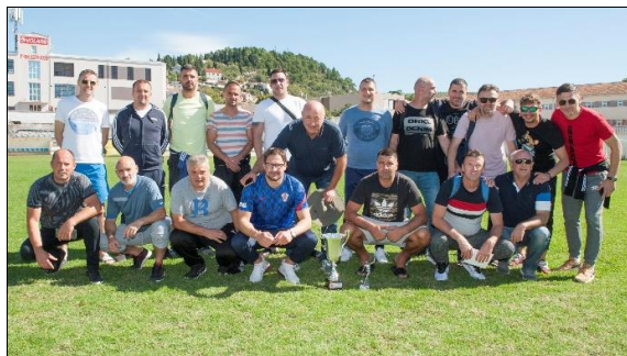
4. - mjesto: NK Dugopolje