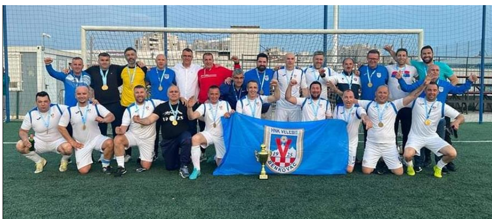
Prvaci LV NS Zadarske županije, sezona 2022./2023., Velebit Benkovac