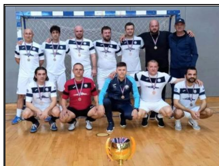
MNK Knin, 3. mjesto