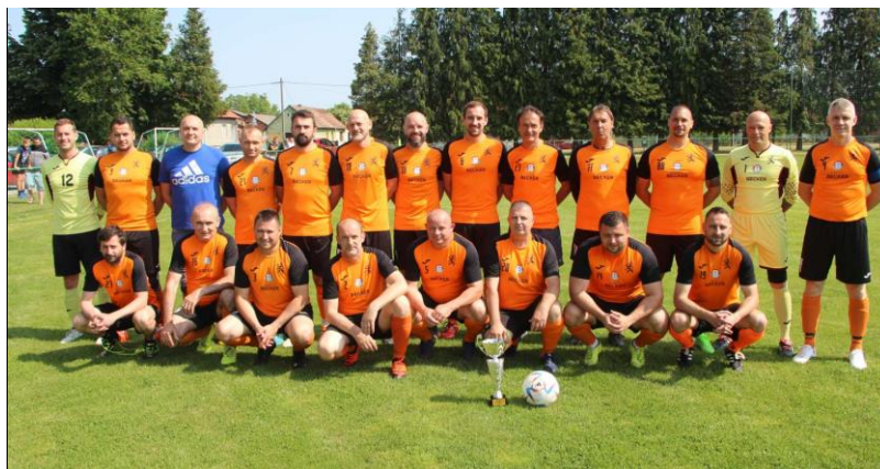
Prvaci LV NS Virovitičko-podravske županije, sezona 2022./2023., NK Virovitica