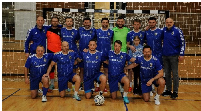
Pobjednici, veterani VNK Lokomotiva Zagreb