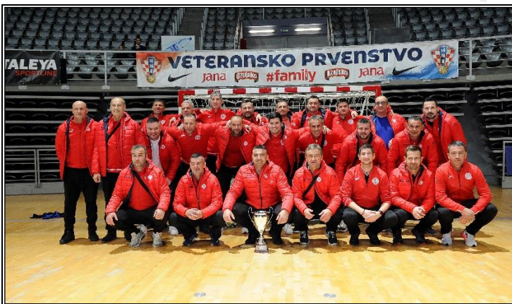
četvrto mjesto; NK GOŠK, Kaštela