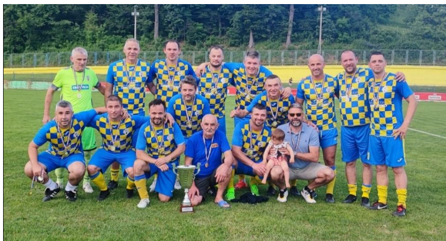
Prvaci LV NS Zaprešić, sezona 2022./2023., veterani Zaprešić