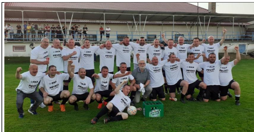
Prvaci I. ŽNL NS KKŽ, sezona 2022./2023., Omladinac Herešin