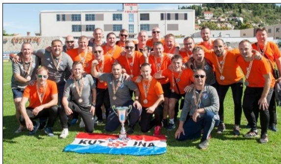
3. - mjesto: HNSK Moslavina, Kutina