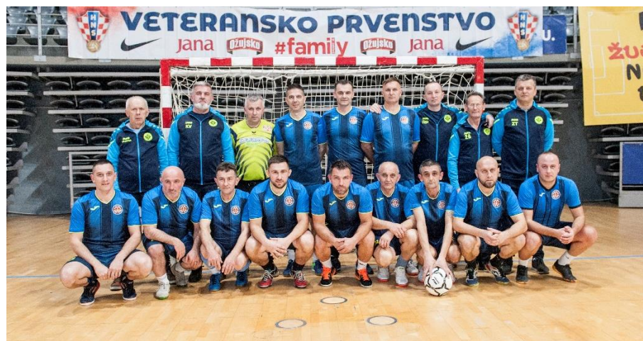
Nastup na 20. dvoranskom prvenstvu veterana HNS-a u Zadru 24.-26. veljače 2023.