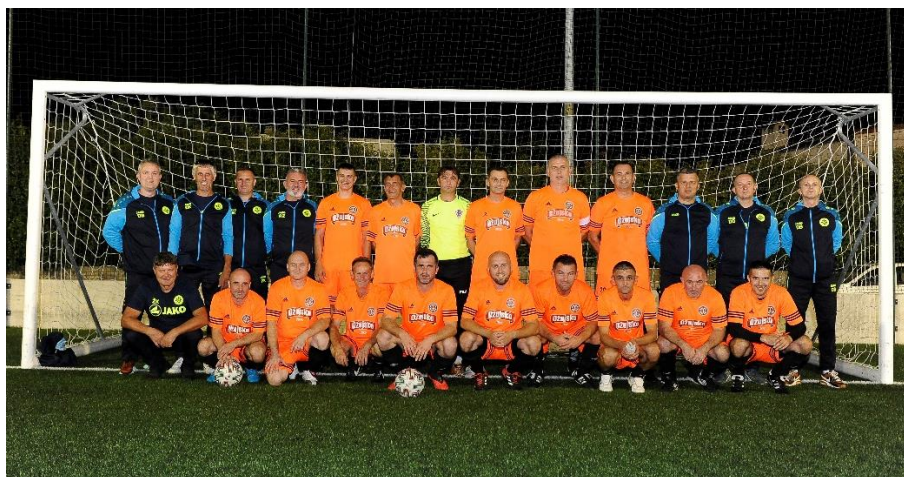
Nastup na 22. prvenstvu veterana HNS-a u Metkoviću 30. rujna do 2. listopada 2022.