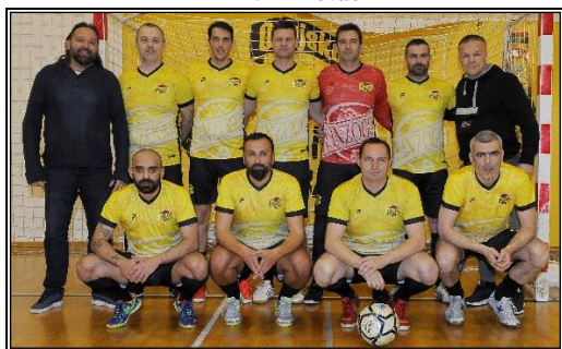
Futsal klub Banzogo, Šibenik